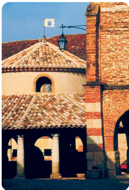
Halle circulaire d'Auvillar

si l'on veut jumeller les 2 circuits (5 km supplémentaires), continuer tout droit puis emprunter la D11 sur la gauche. A hauteur des maisons neuves, suivre alors à droite la voie goudronnée. A partir de ce point, se reporter au descriptif du « circuit de Poutoy » à partir de 2 .