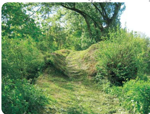
Sentier de Poutoy