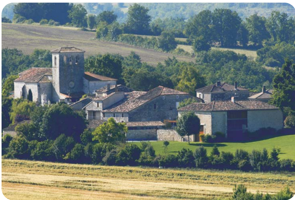
Village de Gasques