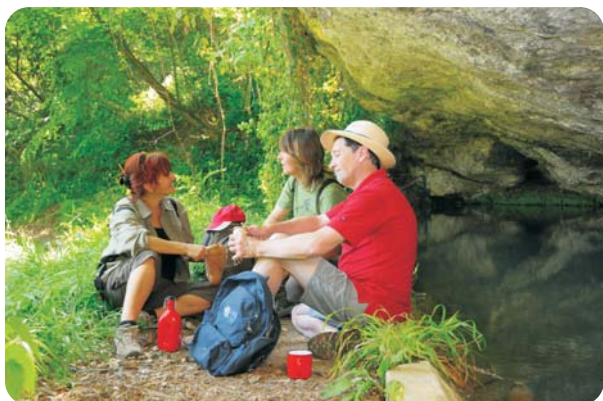
Source sous roche de Roquebiard