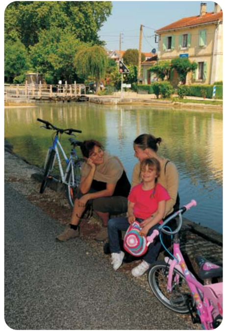
Écluse de Valence d'Agen