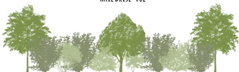
Un grand nombre de persistants