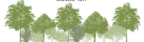
Une strate arborée dense